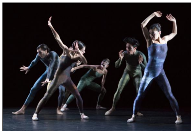
Premiere von „Schläpfer/July“ am Oldenburgischen Staatstheater: „Concertante“