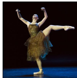
Premiere von „Schläpfer/July“ am Oldenburgischen Staatstheater: „Ramifications“