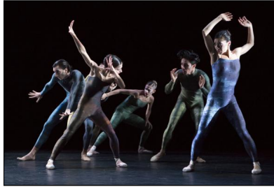
Premiere von „Schläpfer/July“ am Oldenburgischen Staatstheater: "Concertante"