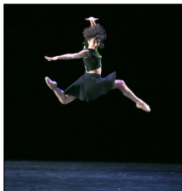
Premiere von „Schläpfer/July“ am Oldenburgischen Staatstheater: „Begegnen ohne sich zu sehen“