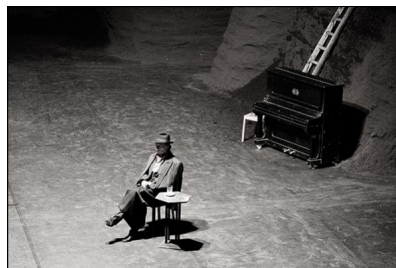
Das Tanztheater Wuppertal mit Pina Bauschs "Viktor" in Hamburg