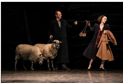
Das Tanztheater Wuppertal mit Pina Bauschs "Viktor" in Hamburg

„Viktor“ – das ist ein wehmütiges Erinnern an die Meisterschaft einer großartigen Choreografin. Mehr davon, bitte.