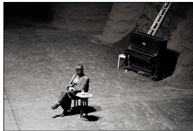
Das Tanztheater Wuppertal mit Pina Bauschs "Viktor" in Hamburg