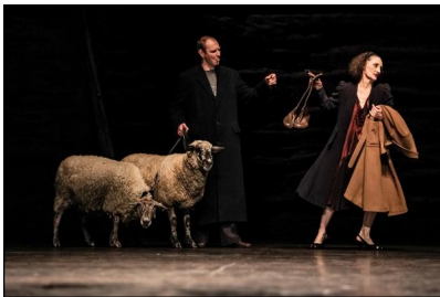
Das Tanztheater Wuppertal mit Pina Bauschs "Viktor" in Hamburg

„Viktor“ – das ist ein wehmütiges Erinnern an die Meisterschaft einer großartigen Choreografin. Mehr davon, bitte.