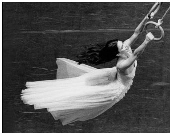
Das Tanztheater Wuppertal mit Pina Bauschs "Viktor" in Hamburg