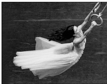
Das Tanztheater Wuppertal mit Pina Bauschs "Viktor" in Hamburg