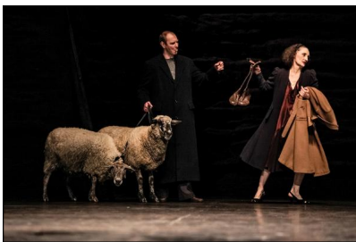
Das Tanztheater Wuppertal mit Pina Bauschs "Viktor" in Hamburg

„Viktor“ – das ist ein wehmütiges Erinnern an die Meisterschaft einer großartigen Choreografin. Mehr davon, bitte.