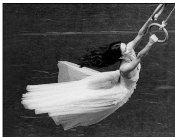
Das Tanztheater Wuppertal mit Pina Bauschs "Viktor" in Hamburg