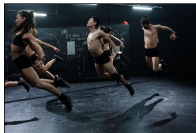
„Seid was ihr wollt“ von Massimo Gerardi