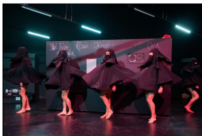
„Seid was ihr wollt“ von Massimo Gerardi