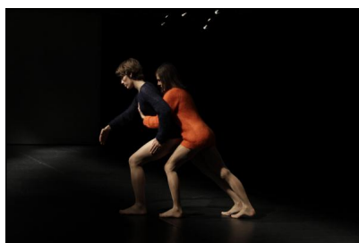
„At Close Distance“ von Christina Ciupke und Ayşe Orhon © Diego Agulló