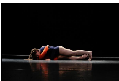
„At Close Distance“ von Christina Ciupke und Ayşe Orhon