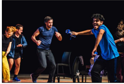
„El Baile“ von Mathilde Monnier