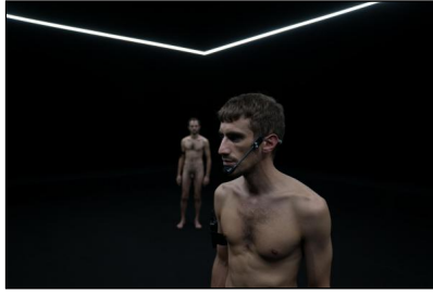
„Dark Field Analysis“ von Jefra van Dinther