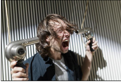
"INAROW" von der go plastic company

kein Vorhang schließen. Und schon wummern knallende Klänge einer absurden Klanginstallation aus dem Foyer, es geht weiter, ganz sicher nicht der Reihe nach, so wie man will, bei diesem Fest für die Freiheit der Kunst, die ganz im Sinne der bisherigen Arbeiten von go plastic keine Grenzen der Genres, der Räume, der Klänge, kennt. Und das ist mal wieder so ein Abend mit Langzeitwirkung, die Bilder, die Klänge, die Rätsel, sie bleiben im Kopf, das Theater geht weiter.