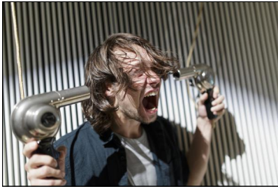
"INAROW" von der go plastic company

kein Vorhang schließen. Und schon wummern knallende Klänge einer absurden Klanginstallation aus dem Foyer, es geht weiter, ganz sicher nicht der Reihe nach, so wie man will, bei diesem Fest für die Freiheit der Kunst, die ganz im Sinne der bisherigen Arbeiten von go plastic keine Grenzen der Genres, der Räume, der Klänge, kennt. Und das ist mal wieder so ein Abend mit Langzeitwirkung, die Bilder, die Klänge, die Rätsel, sie bleiben im Kopf, das Theater geht weiter.