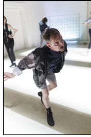
"INAROW" von der go plastic company