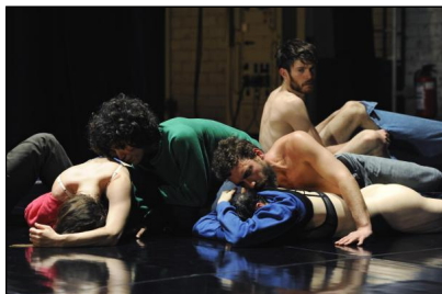
Until Our Heart Stops von Meg Stuart © Iris Janke

Bis 22.10., HAU 2, Hallesches Ufer 32, Kreuzberg, Tickets unter 259 004 27, www.hebbel-am-ufer.de