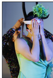
Until Our Heart Stops von Meg Stuart