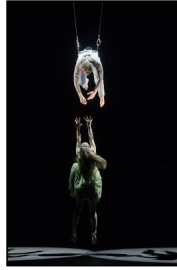
"Peer Gynt" von Gregor Zöllig