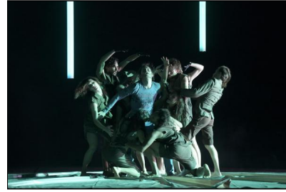
"Peer Gynt" von Gregor Zöllig