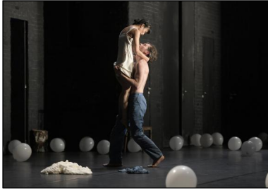
"Peer Gynt" von Gregor Zöllig