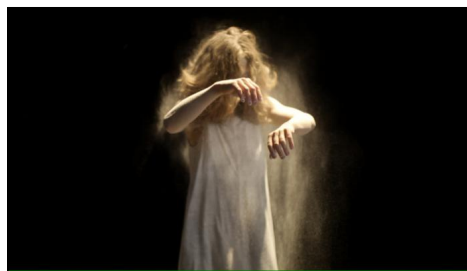
Zwischenwelten © Aidan Jara