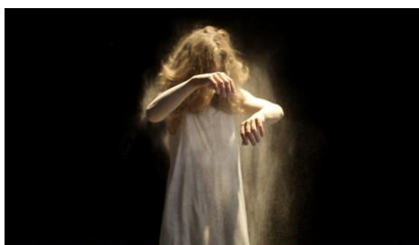
Zwischenwelten © Aidan Jara