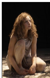
Zwischenwelten © Aidan Jara