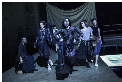
JULIET & ROMEO von Trajal Harrell