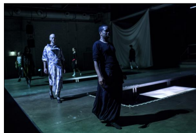
JULIET & ROMEO von Trajal Harrell