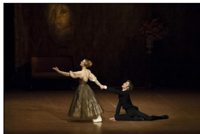
"Onegin" von John Cranko © Stuttgarter Ballett