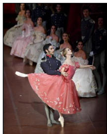
"Onegin" von John Cranko