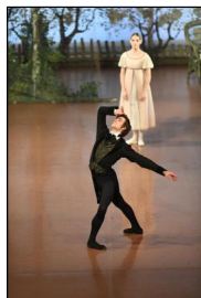
"Onegin" von John Cranko