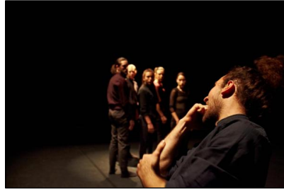
"Curious Minds" im LOFFT Leipzig