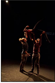
"Curious Minds" im LOFFT Leipzig