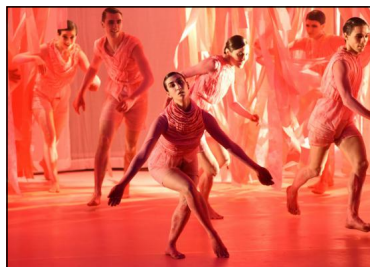
„Bullshit“ von Nadav Zelner für Gauthier Dance. Tanz: Ensemble