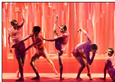
„Bullshit“ von Nadav Zelner für Gauthier Dance. Tanz: Ensemble