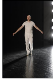
"Katema" von Lucinda Childs; Ty Boomershine