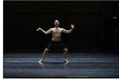
"Oui" von Ivo Dimchev für das DANCE ON Ensemble; Christopher Roman