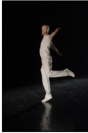
"Katema" von Lucinda Childs; Ty Boomershine