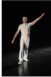
"Katema" von Lucinda Childs; Ty Boomershine