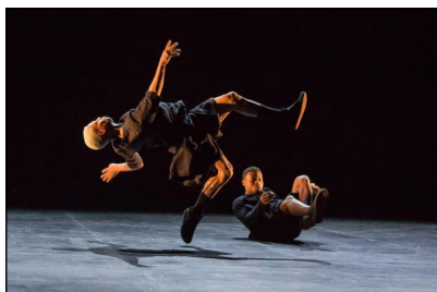
„Inoah“ von Grupo de Rua / Bruno Beltrão