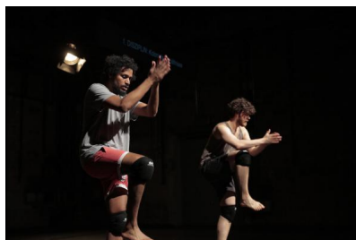
„Situation mit Doppelgänger“ von Julian Warner / Oliver Zahn / HAUPTAKTION