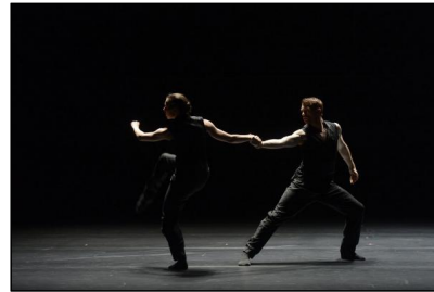
Crystal Pite zeigt mit dem Ballet BC "Solo Echo" beim Festival Movimentos 2018