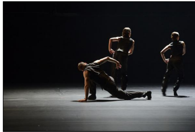
Crystal Pite zeigt mit dem Ballet BC "Solo Echo" beim Festival Movimentos 2018