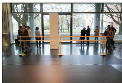
„Dancer inside Brazil“