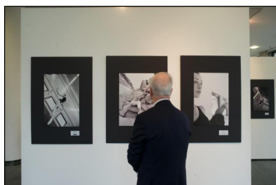
„Dancer inside Brazil“

Seit Jahren fotografiert Dieter Hartwig für tanznetz.de Ballett und zeitgenössischen Tanz hauptsächlich, aber nicht nur in Berlin. Mit seinen oft täglichen Sendungen an Fotos ist er zum Chronisten der Tanzszene in der Hauptstadt geworden. Doch leider findet nur ein Bruchteil seiner Fotos Eingang in Tanzkritiken, da die Rezensionen für tanznetz.de bei Weitem nicht so zahlreich sind wie die Fotodokumentationen Hartwigs. Schon sehr lange geplant, haben wir nun eine Fotoblog-Serie gestartet, die in loser Reihenfolge fortgesetzt werden soll. Bei Hartwig, der in Bildern sieht und denkt, werden die Fotos die Hauptrolle spielen - unterstützt durch kleine Kommentare oder Gedanken, die er sich beim Fotografieren oder der Durchsicht der Ergebnisse macht.