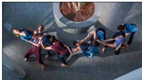
"CLOSE_INSIGHT" von Tiago Manquinho beim TanzArt ostwest 2018